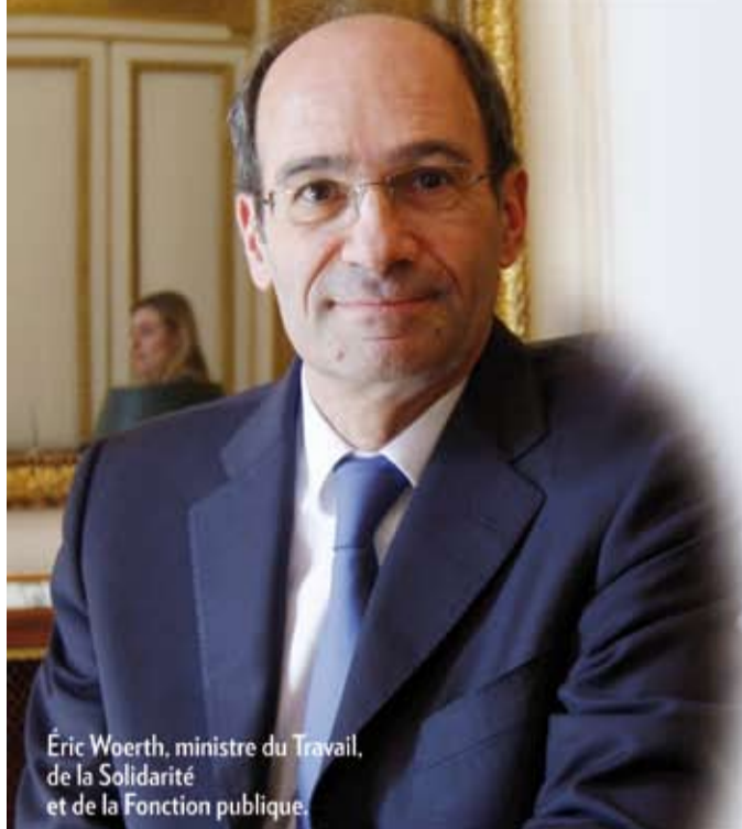
Eric Woerth, ministre du Travail, de la Solidarité et de la Fonction publique.